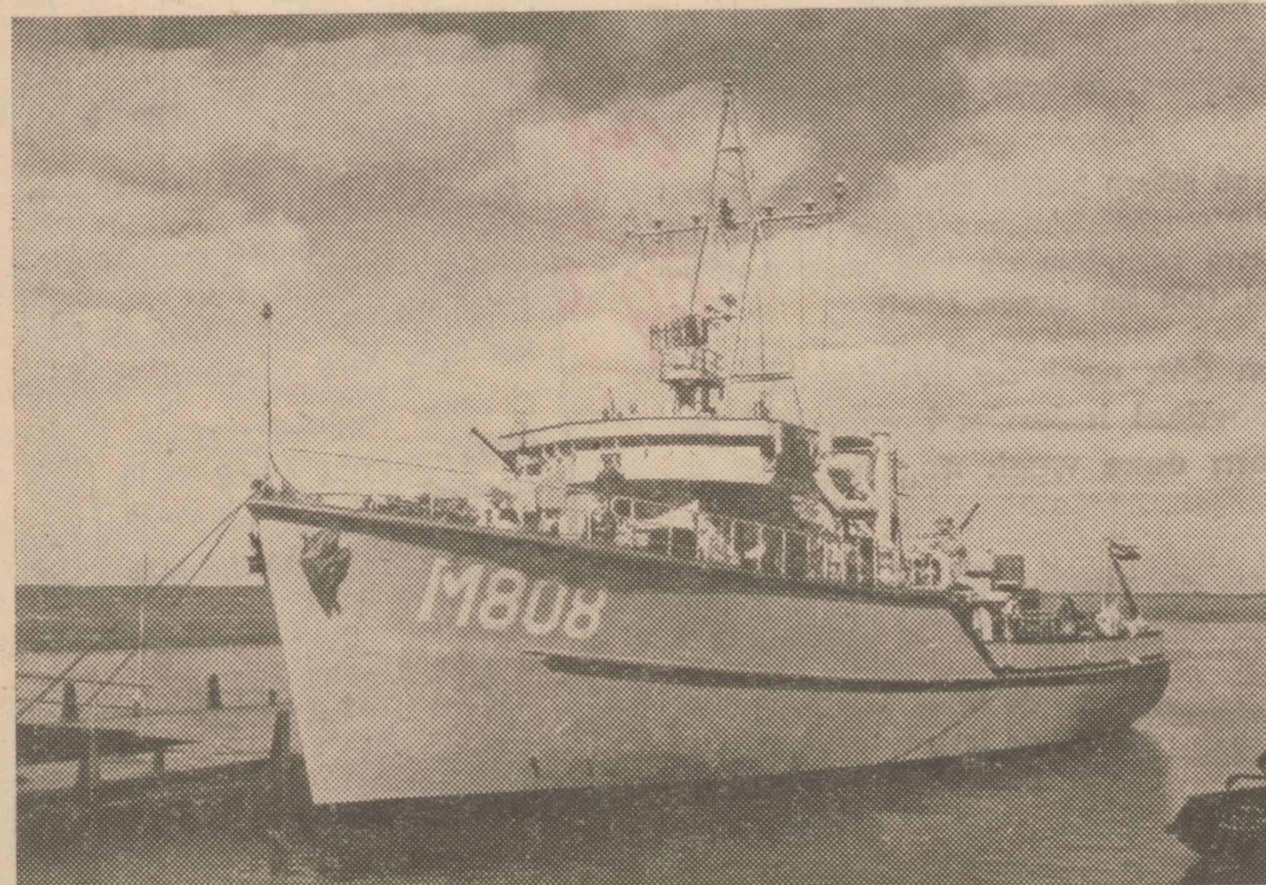
Hr. Ms. mijnenveger „AXEL“ tijdens haar bezoek aan Zeeuwsch-Vlaanderen